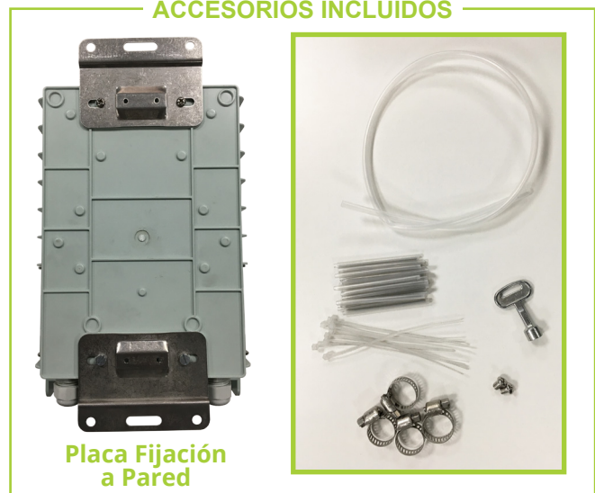
Placa Fijación a Pared

Datos sujetos a modificaciones del fabricante.