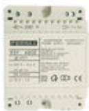
F04802 ALIMENTADOR DIN4 230VAC/12VAC-1A