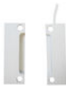
FE01076 CONTACTO MAGNETICO MC740 G2