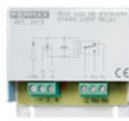
F02013 RELE FUNCIONES ADICIONALES