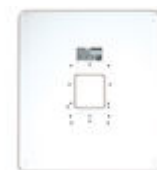
F03389 MARCO UNIVERSAL LARGE