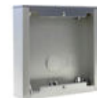
F07061 CAJA SUPERFICIE CITY S1