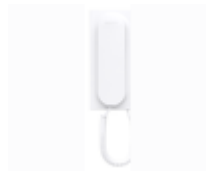
F03443 BRAZO VEO CON BUCLE INDUCTIVO