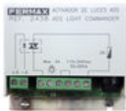
F02438 ACTIVADOR LUCES-TIMBRE VDS