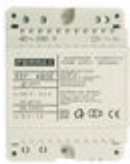
F04802 ALIMENTADOR DIN4 230VAC/12VAC-1A