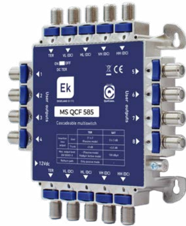
MS QCF 585