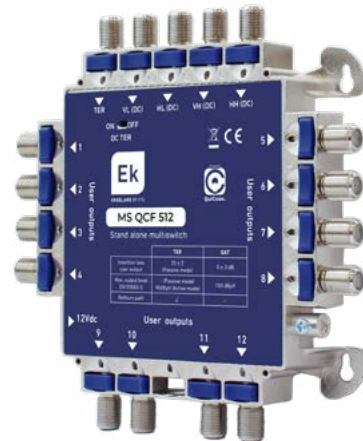
MS QCF 512