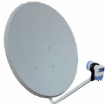
ODS60 · ODS 82