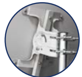
Cabezal OD 100