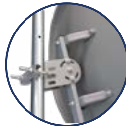
Cabezal ODS 60 / ODS 82