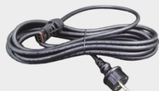
Cable de alimentación