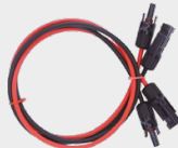
Cables de conexión