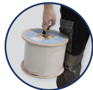
ASA BOBINA EK ROLLER