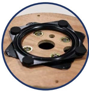
MECANISMO EK ROLLER